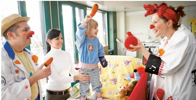
Die Spitalclowns Dr. Trallalla und Dr. Pfnüsel der Stiftung Theodora bringen die kleinen Patienten des Kinderspitals Luzern zum Lachen.

ein Herz. Dieses hat uns zu unserem Beruf geführt: Wir möchten anderen helfen. Unser Herz leitet uns an, allen Menschen mit Respekt, Toleranz und einem offenen Ohr zu begegnen. Es unterstützt uns, den Menschen in schwierigen Situationen beizustehen. Und es hilft uns, auch einmal zu lachen, Zuversicht und Energie zu schenken.