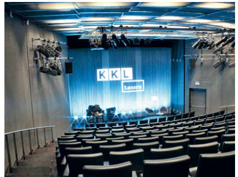
Auditorium, Kultur- und Kongresszentrum Luzern