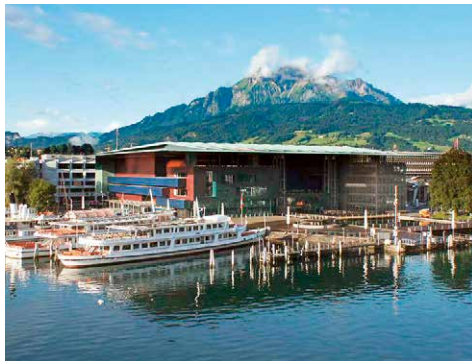
Kultur- und Kongresszentrum Luzern