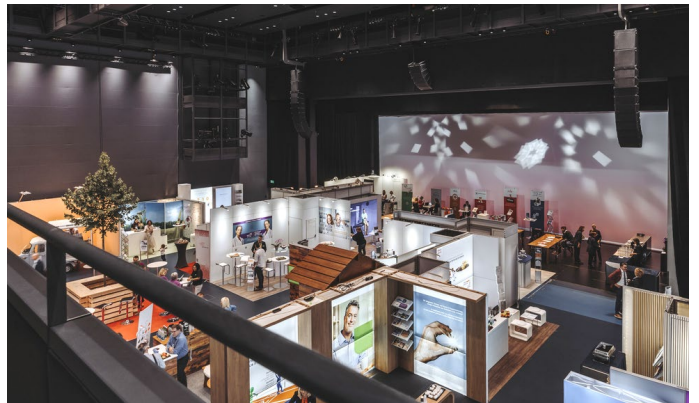
Luzerner Saal Foyer/Erweiterung (Industrieausstellung)