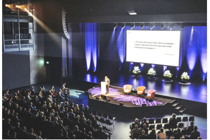
Luzerner Saal (Vorträge)